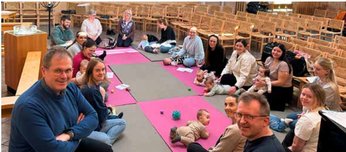
Då prosten var i Kvinnherad ein onsdag i mars fekk han m.a. oppleva både babysong og kyrkjekafé i Valen kyrkje.

vanlege salmane, men me bør òg ta oss tid til å øva på meir moderne stoff i salmeboka.